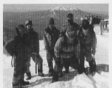
木曾駒ヶ岳頂上にて

朝方より降り続く湿雪の中を下山。温泉に入って帰路へ。伊那谷からの入山が主流の昨今、木曾谷の上松道は高低差1900mのクラシックルトで、昔ながらのアルピニズムが味わえた。