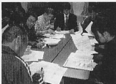
リーダーによる検討会

その後、各山城ごとに分かれ、計画書を交換しながらコースや幕営地などについて意見を交した。